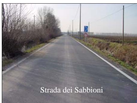
Strada dei Sabbioni