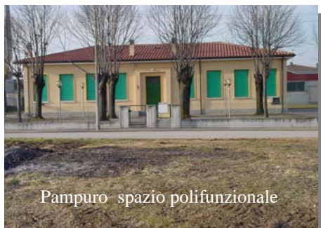
Pampuro spazio polifunzionale

Altri interventi sulla sicurezza stradale sono stati concordati con la Provincia di Verona, alcuni sono stati eseguiti altri verranno eseguiti nella prossima primavera.