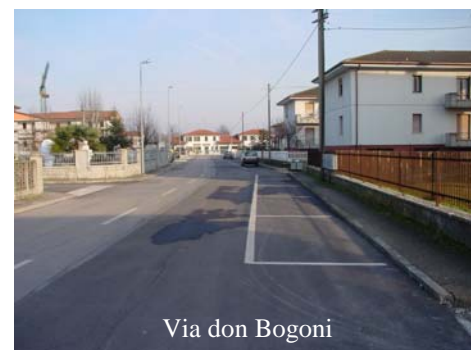
Via don Bogogni