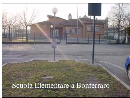
Scuola Elementare a Bonferraro

Questo è un bel esempio di come di come si possono raggiungere dei grandi risultati riuscendo a lavorare insieme con