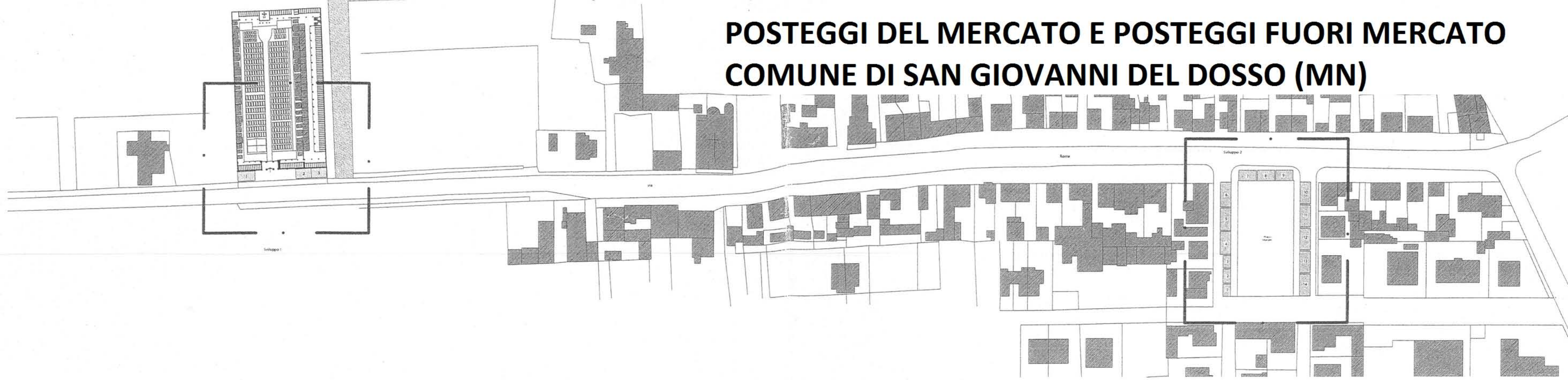
Sviluppo 1: Individuazione posteggi area cimiteriale