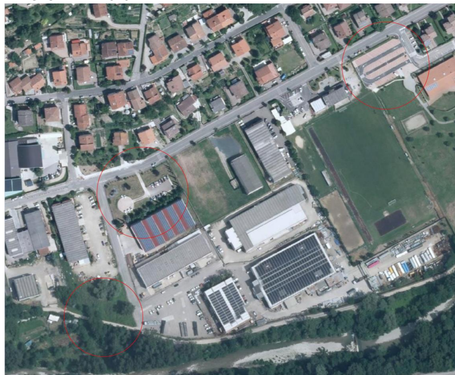
FOTO AEREA 2016

Come detto in premessa, l'amministrazione Comunale ha ricevuto una proposta di acquisto di quest'area da parte di un'Azienda privata, già presente al Corsalone nelle vicinanze con uno stabilimento realizzato di recente e già nella necessità di un sostanzioso ampliamento dell'attività.