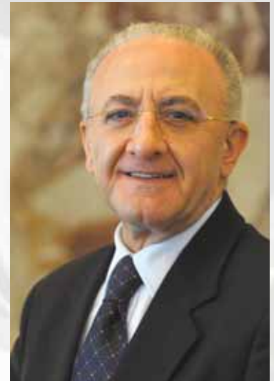
On. Vincenzo De Luca Presidente Regione Campania

Ritengo che questo calendario ci offra una bella opportunità per esprimere riconoscenza alle donne e agli uomini delle Polizie Locali della Campania, incoraggiandoli a proseguire con abnegazione nella propria attività. Auguri buon 2017.