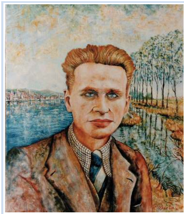
"Alberto Caracciolo", 1994 - Olio su tela cm. 50x70 (S. Pietro di Morubio, Biblioteca Comunale)