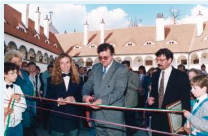
Mostra "Charlie a Topolčianky" - aprile 1996 -