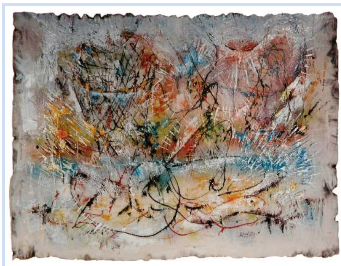
"Il Pescatore" , 1995 - Tecnica mista su tela cm. 153x114 ( propr. Idelmino Bellani, Rovigo)