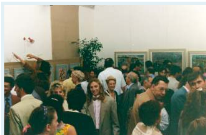
Mostra "Simultaneità e suono nella pittura di Charlie" chiosstro della basilica Beata Vergine del Tresto (PD) - Ottobre 1994