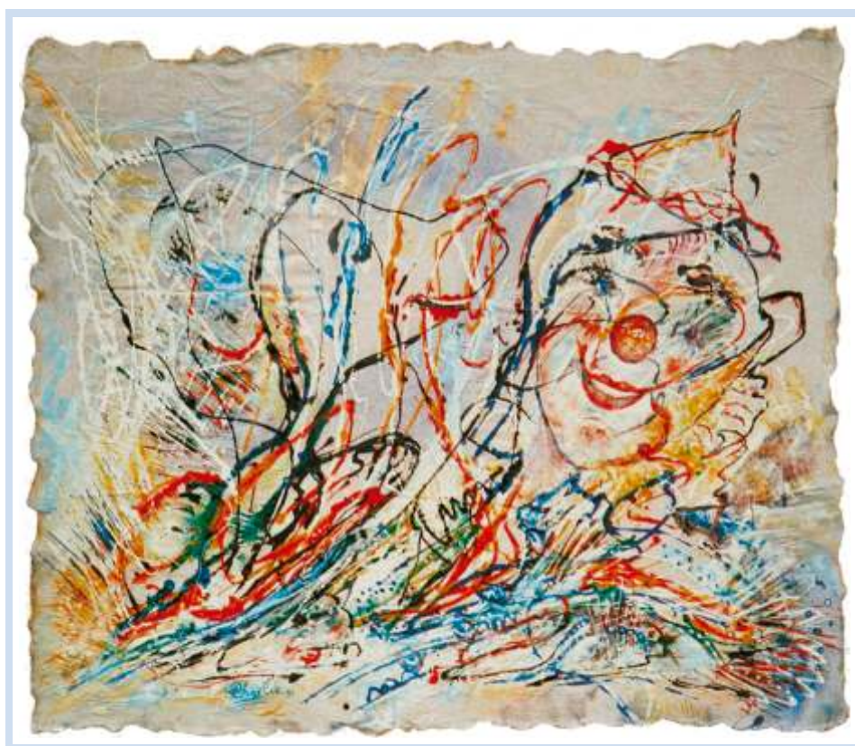
"Il Domatore di anatre" , 1997 - Tecnica mista su tela cm. 105x87 (primo premio Repubblica di S. Marino, 6-10-2001)