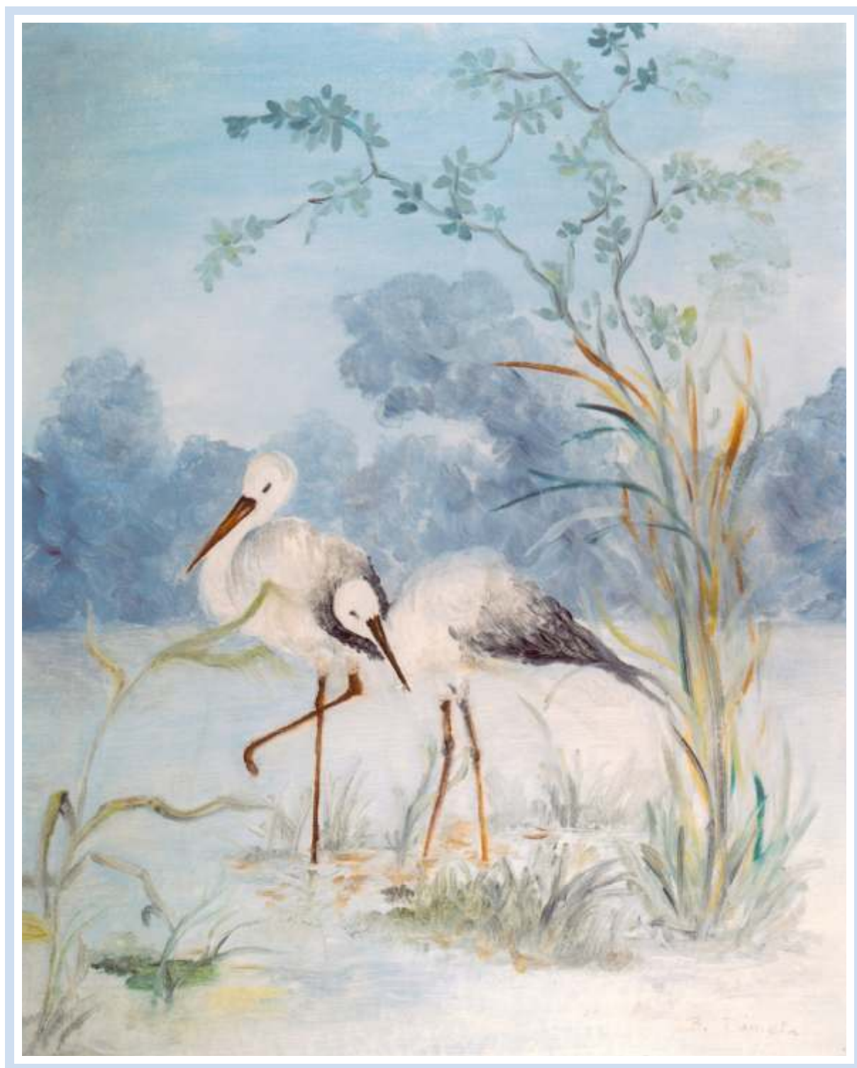
"Idillio" , 1997 - Olio su tela cm. 40x50