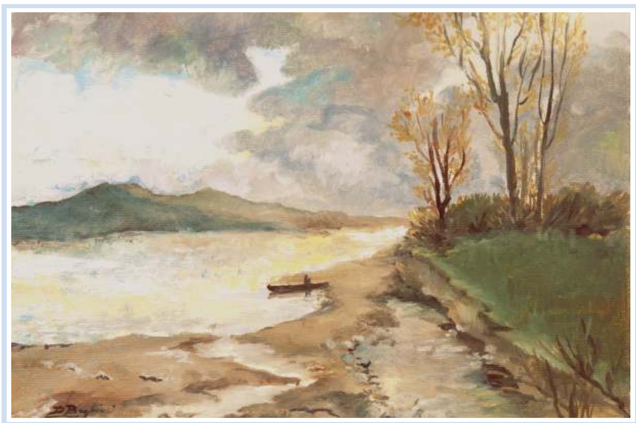
"Lungo il corso del fiume" , 2004 - Olio su tela cm. 24x18 (copia d'autore)