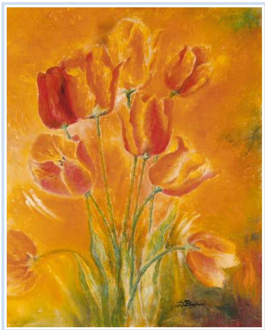
"Tulipani" , 2004 - Olio su tela cm. 40x50