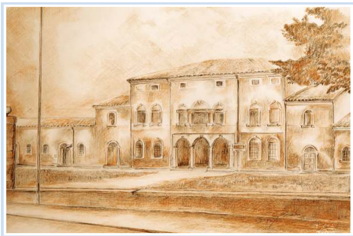
"Com'era Villa Verità a S. Pietro di Morubio" , 2004 - Pastelli su carta cm. 48x33