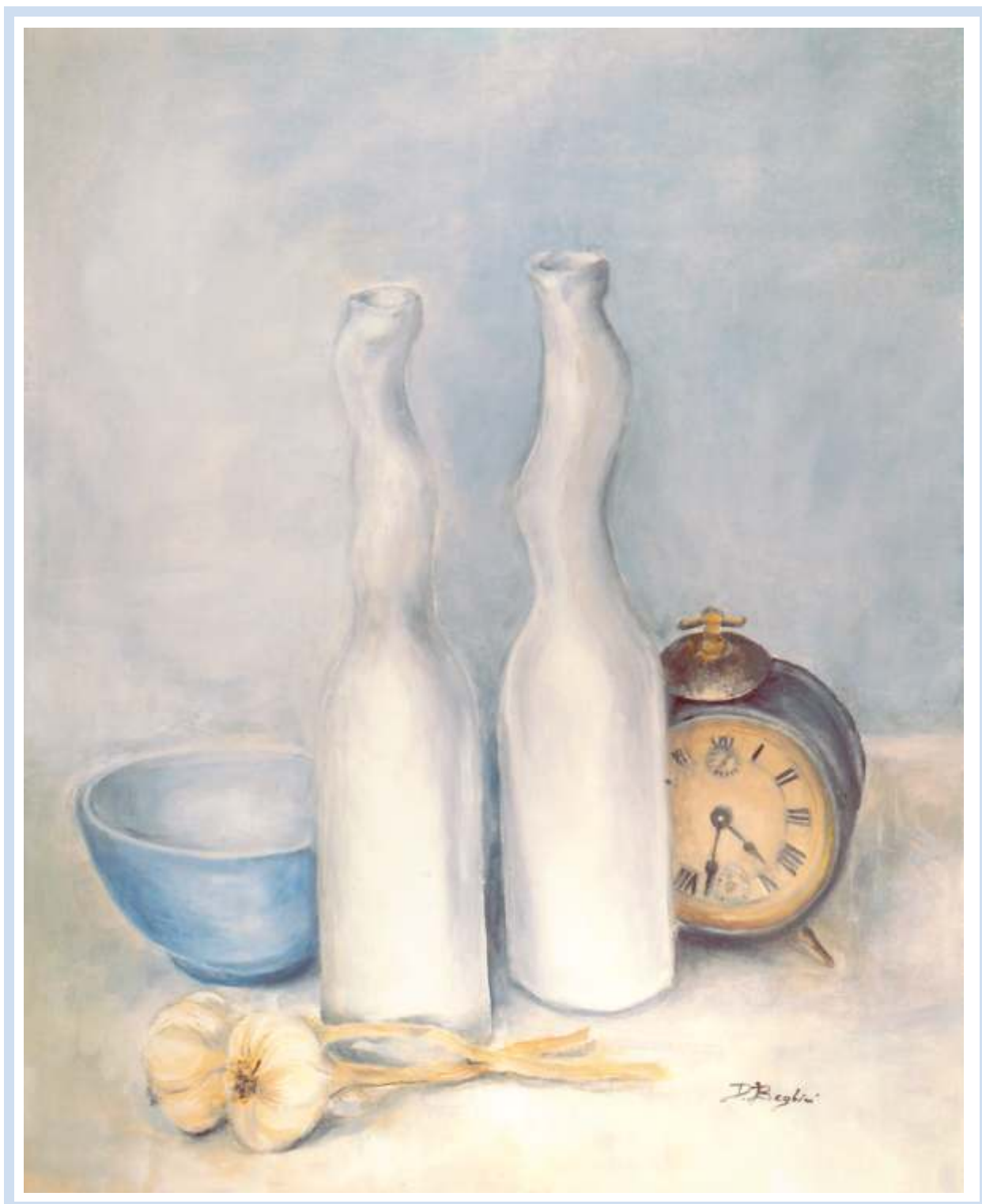
"Tra presente e passato" , 2004 - Olio su tela cm. 50x40