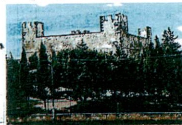
Castello di Sanluri

L'Amministrazione scegliendo questo programma per i suoi concittadini vuole dare un impeccabile servizio che concorre a creare le condizioni ideali per una VACANZA-SALUTE-CULTURA, in un clima di confort e di autentico relax.