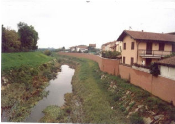
L'argine del Banna, a monte del ponte, costruito dopo l'alluvione del 1994.

L'ultima alluvione, la più disastrosa della storia è avvenuta nel 1994; dopo si è provveduto a nuovi argini e altre opere.