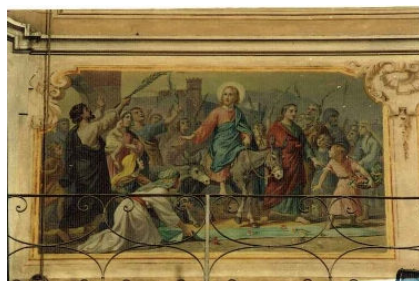
LA CHIESA PARROCCHIALE