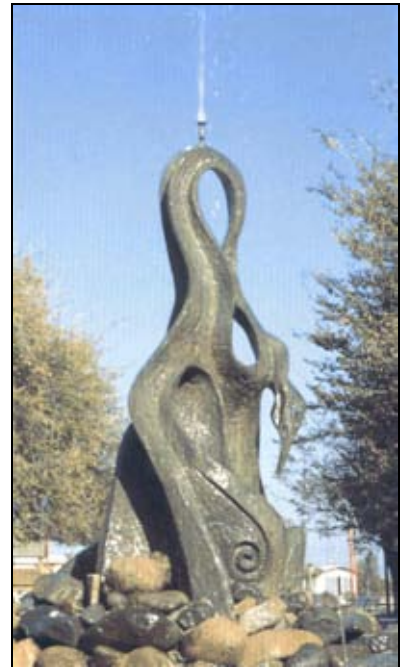
Cigno bronzeo in Piazza Resistenza a Furtei

Tra le sue attività si evidenziano: nel 1973 un quadro "Omaggio a Alexander Solschenizyn"; nel 1975 studia insieme a Moschino all'accademia della moda in Roma; nel 1976 partecipa all'Esposizione Internazionale dei giovani artisti romani e parigini presso il Palazzo delle Esposizioni in Roma e vince il 1° premio di pittura; nel 1977 è vincitore del premio Perseo a Firenze, nel 1978 è vincitore del premio Sironi a Milano. Partecipa a numerose mostre tra cui 1° Antologica alla galleria Boccioni di