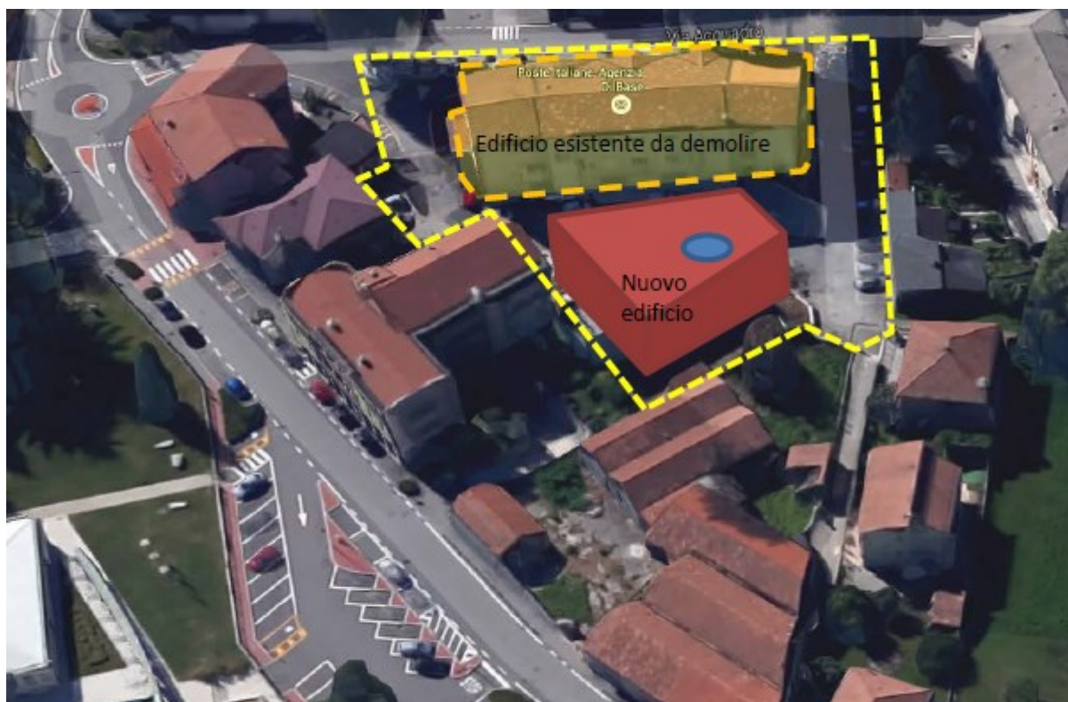
Area comunale ASL-POSTE e Magazzino comunale: Assonometria di Progetto