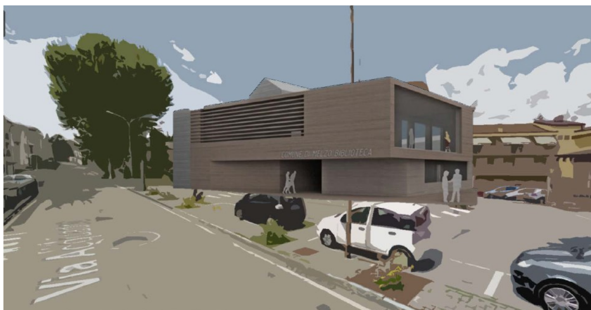
Area comunale ASL-POSTE e Magazzino comunale: Rendering di Progetto