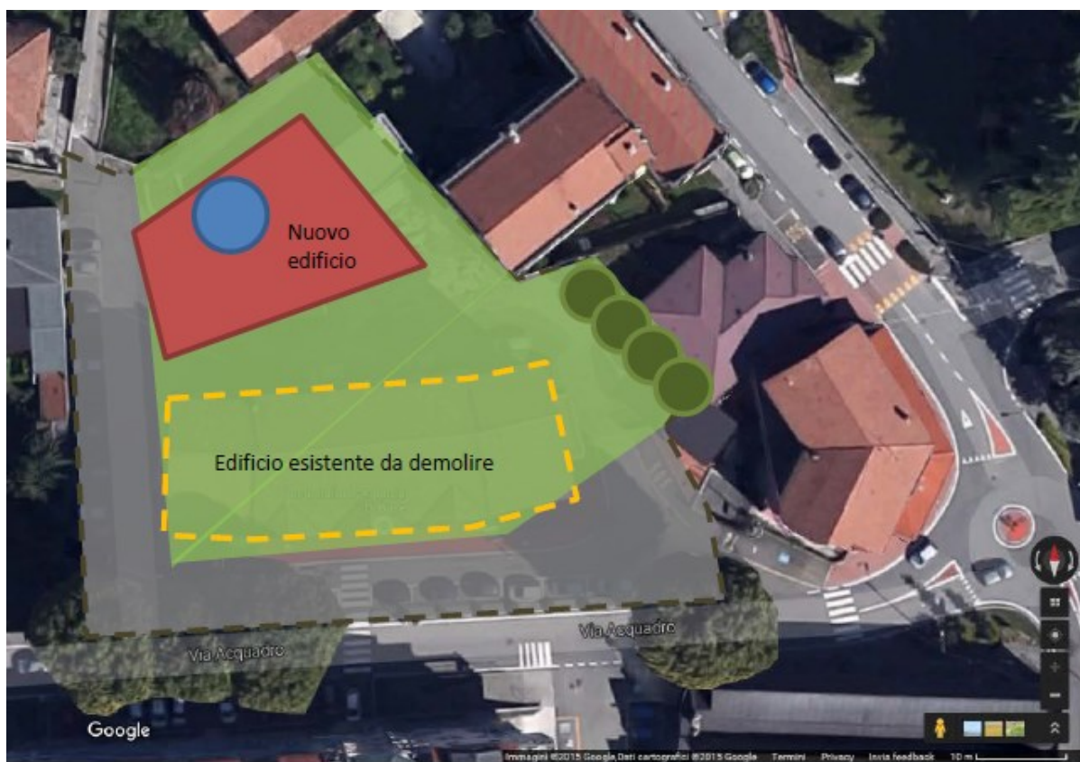
Area comunale ASL-POSTE e Magazzino comunale: Planimetria di Progetto