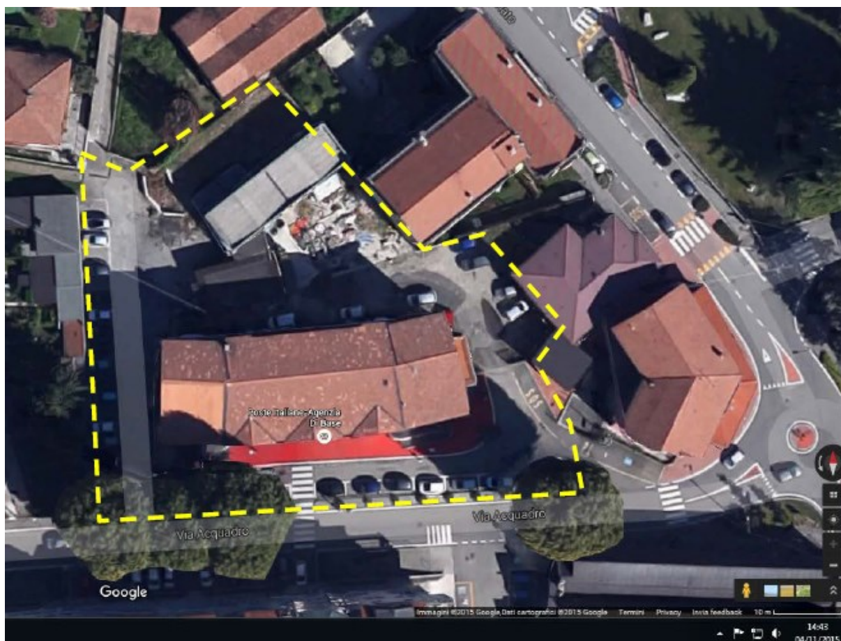
Area comunale ASL-POSTE e Magazzino comunale: Planimetria stato di fatto