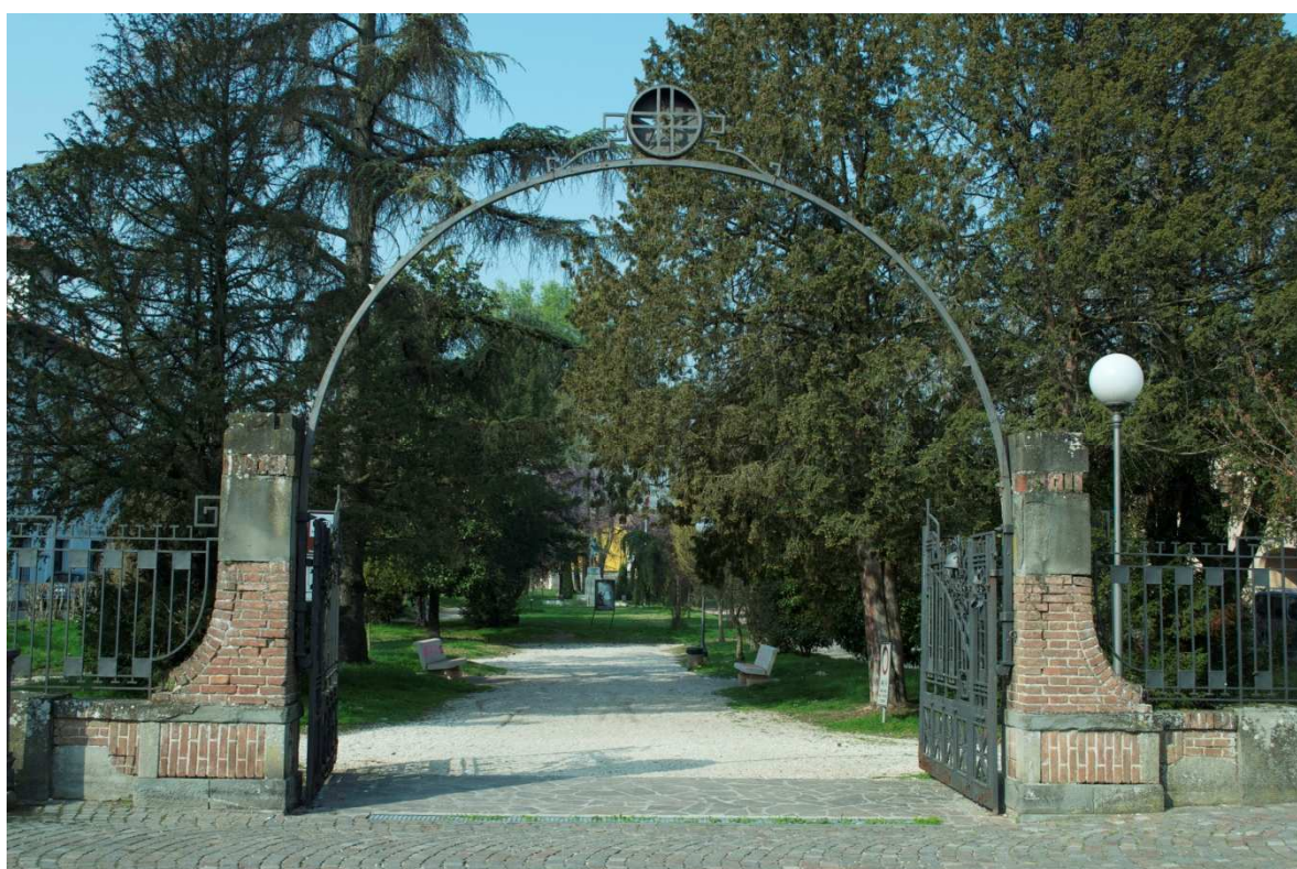
Giardini vecchi di Viadana