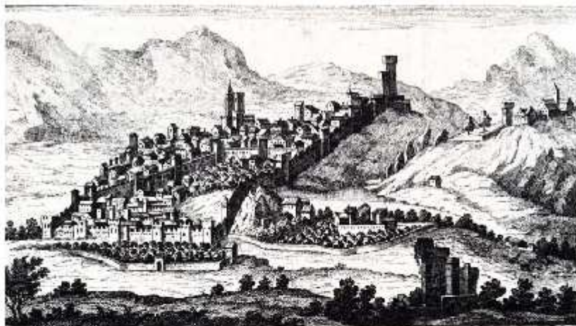
La Città di Terracina nella Provincia detta la Campagna di Roma.